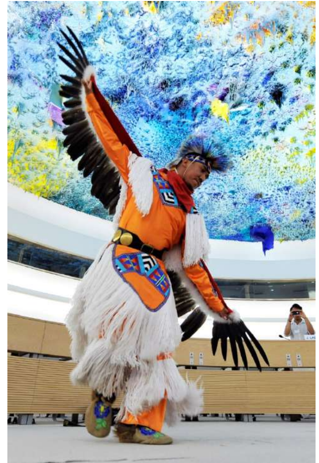
The Yellow Bird Apache Dancers.

El conocimiento tradicional, junto con la ciencia, ha demostrado ser una base de conocimiento efectiva para el manejo de especies y ecosistemas (a través de la conservación in situ) al establecer y administrar áreas protegidas comunitarias.