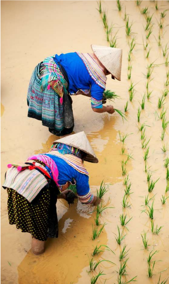
Indigenous Hmong Women - Bac Ha, Viet Nam